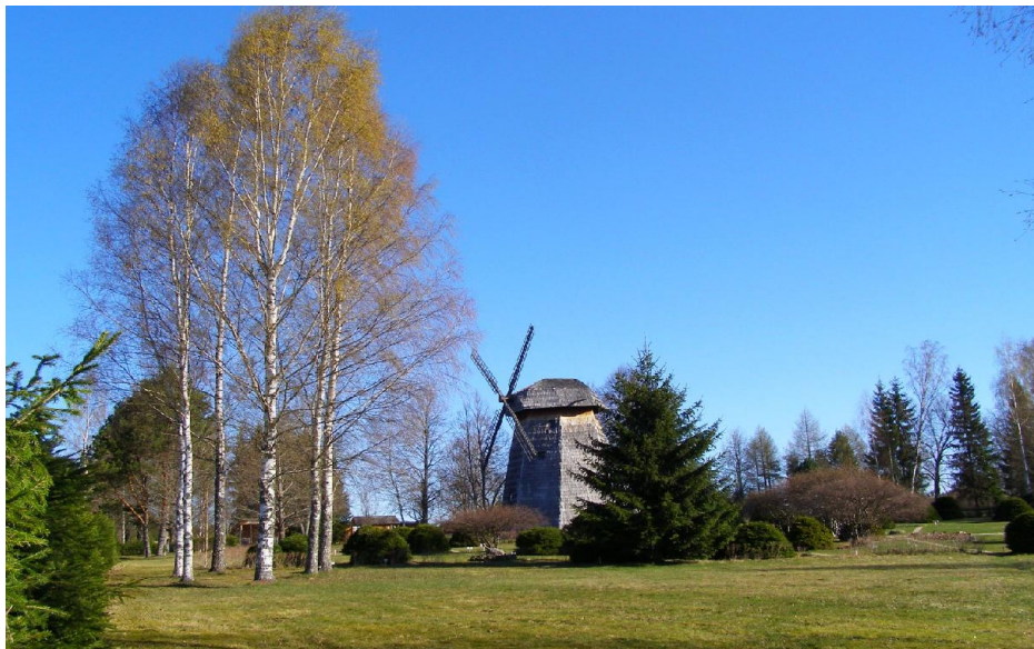
Tuulik varakevadel, meie logo ja sümbol, pildistajate üks lemmikkoht

Vahel hiilitakse ka ümber nurga või naaberkrundi kaudu, selle asemel, et osta pilet, mis on pigem sümboolse hinnaga. Muuseumipersonalile on jäänud arusaamatuks selliste inimeste mõtteviis: lõbustusparki või kinno ei proovi keegi niisama tasuta minna, kuid meil öeldakse, et me ainult natuke vaatame. See näitabki, et vahel ei ole väärtushinnangud paigas. Näib, et aastakümnete eest väljakujunenud ekspositsiooniga muuseum oleks külastaja silmis justkui madalamal positsioonil kui äsja avatud, moodsast tehnikast pungil väljapanek, kuhu sisenemise eest ollakse nõus maksma pea 3 korda kõrgemat hinda.