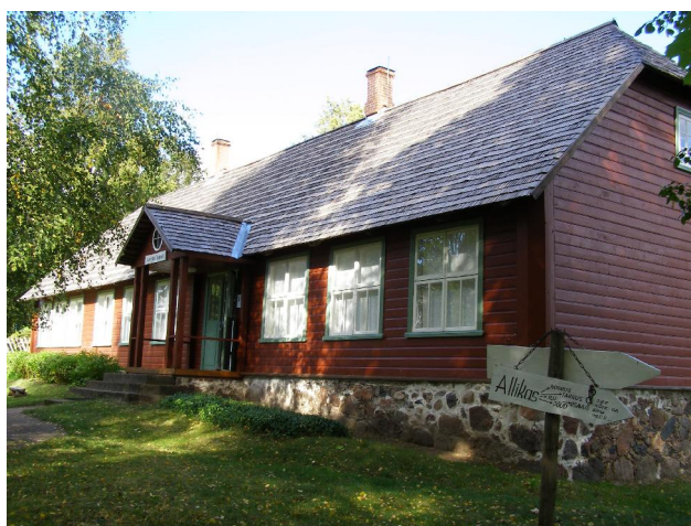
Meie vana koolimaja seest ja väljast