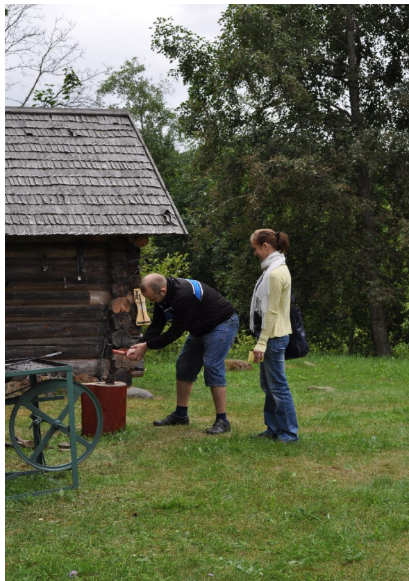
Pärandipäeval korvi punumas ja sepatööd tegemas