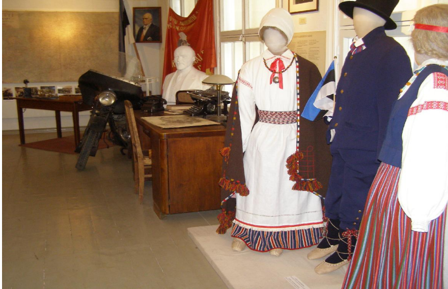
Vaade püsinäitusele Pärisorjast peremeheks.