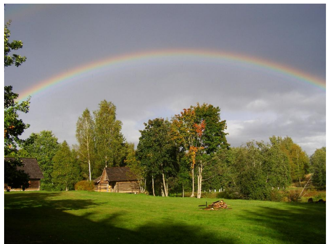
Punaku talu seest ja väljast