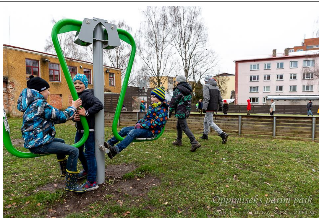
Jõulinnaku elementidel turnimas. Taustal kunstmurukattega jalgpalliplats.