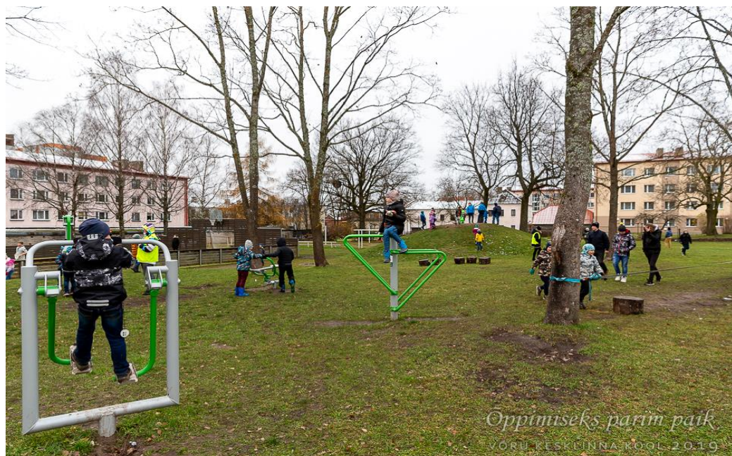
Õpilased õuevahetunnis jõulinnaku elementidel. Kollastes vestides on korrapidajaõpetajad.

tõukerattaga). Igal hommikul oli osalejatel tarvis infostendil oma nime taha panna vastavat värvi kleeps, et oleks näha, mis liikumisviisi kooli tulekuks kasutati. Huvi sellise projekti vastu oli väga suur. Plaanis on korraldada selline kaardistamine ka ühel talve- ja kevadkuul. Tulemustest tehakse õppeaasta lõpus ka kokkuvõtte. Nimetatud projekt on ühtlasi Liikuma Kutsuva Kooli programmi üheks meie tegevuseks. Liikuma Kutsuva Kooli tegevuskava . Seega võib öelda, et autovaba kooliümbruse tagamisel on võtnud VASTUTUSE nii õpetajad, õpilased kui lapsevanemad. Koolihoones ja -hoovis toimuvat saab jälgida 39 turvakaamerast. Kaamerate salvestisi on võimalik vastavalt vajadusele järele vaadata ning salvestiste abil oleme mitmete probleemide osas saanud ütlusi kontrollida või uut infot juurde, et erinevaid juhtumeid efektiivsemalt lahendada. Renoveerimise järgselt on koolis ka lift, mida üldjuhul liikumiseks ei kasutata. Algselt oli õpilaste huvi lifti vastu suur ja eks mõnedki püüdsid seda pisut kurjasti ära kasutada. Nüüdseks on õpilased mõistnud, et trepist liikudes jõuavad nad kohale kiiremini kui liftiga sõites, seda isegi 4. korrusele minnes.