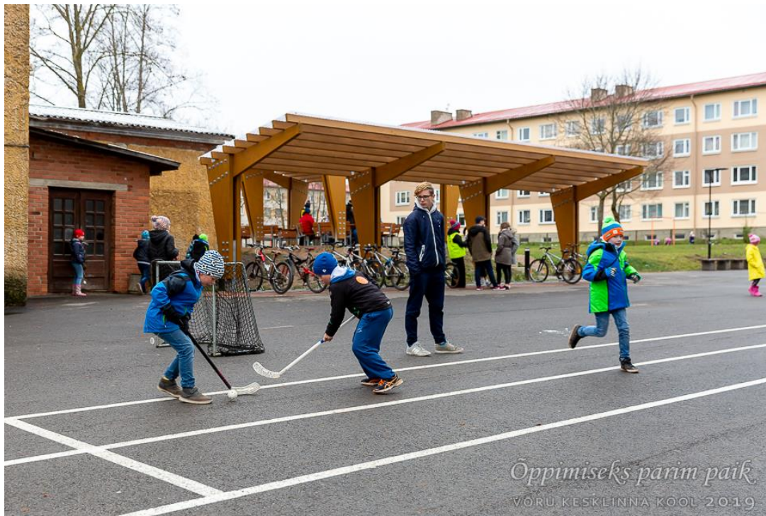
Õpilased õuevahetunnis mängimas tänavahokit. Taustal üks jalgrattahoidlatest.