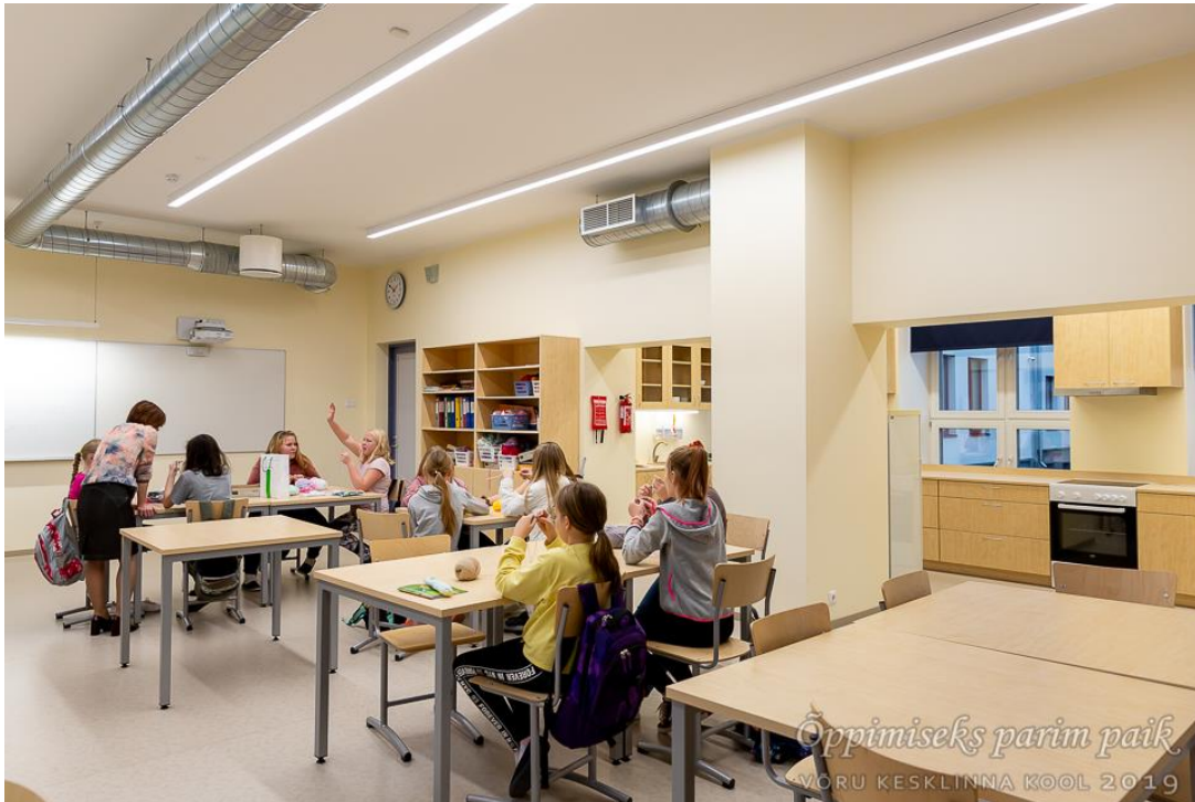
6.c klassi tüdrukud käsitöö tunnis. Paremalt paistab köögiblokk.

Õppetööd toetavad ning ÕPIHUVI tekitavad kindlasti kaasaegsed käsitöö- ja kodunduse, tehnoloogia ja keemiaklass ning võimla , mis on meil nüüd tänu renoveerimisele. Varem ei olnud meie koolis praktiliselt üldse võimalik kodunduse tunde läbi viia, sest puudusid kõik toitlustamisega seotud tingimused ja vahendid. Nüüd on õpilaste kasutada suur ruum, kus ühes pooles toimuvad käsitöötunnid, teises aga asub köök kaasaegse köögitehnikaga.