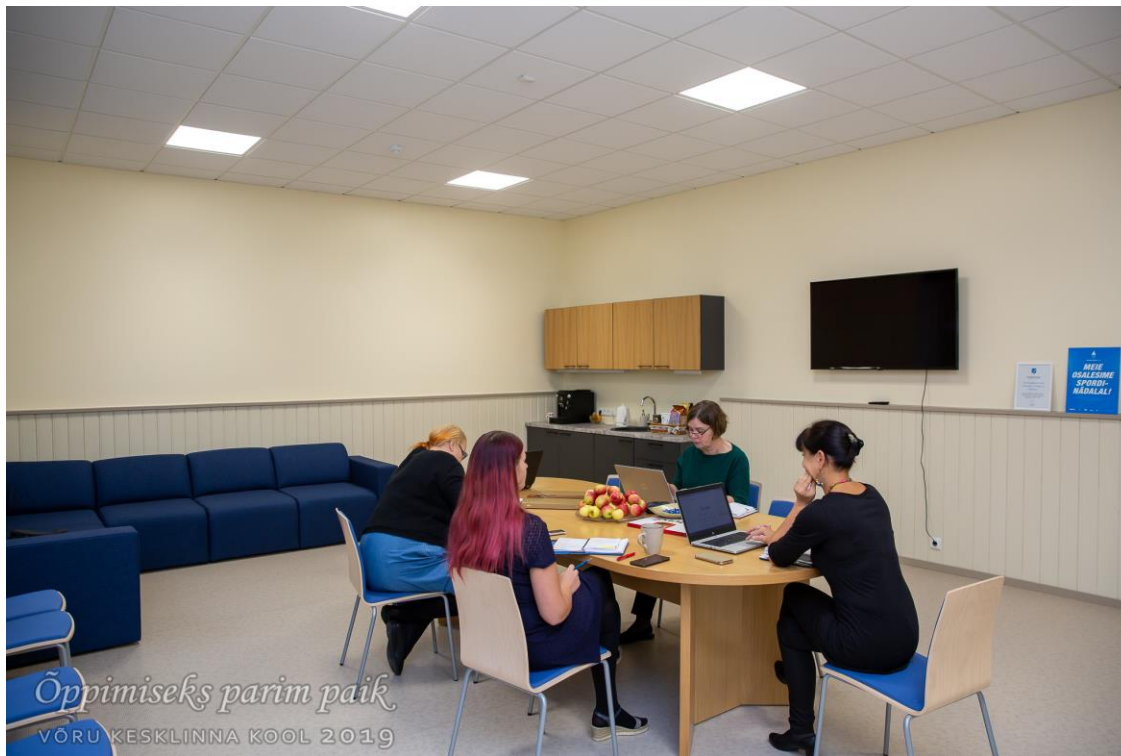
Esmaspäevahommikune juhtkonna koosolek õpetajate toas.

Koolikeskkonna paremaks muutmise raskel teel tahtsime KOOSTÖÖD teha ka lapsevanematega ning otsustasime neid arutellu kaasata. Seekord oli plaan panna vanemad kaasa mõtlema meie poolt etteantud teemadel. Kutsusime kokku kooli ajaloo I mõttetalgud lapsevanematele. Osavõtt osutus kesiseks (2%), sest lapsevanemad pole harjunud, et nende arvamus on koolile nii oluline. Siiani on vanemad harjunud kooli tulema vaid koosolekule või ümarlauale. Lapsevanemate ettepanekuid koolielu arendamiseks pole varem sellise ühise arutelu raames läbi viidud. Need, kes kohale tulid, said osa maailmakohviku põhimõttel üles ehitatud arutelust. Teemade väljaselgitamiseks palusime eelnevalt abi õpetajatelt, kes