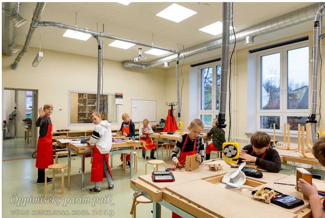
5.b klassi poisid tehnoloogiatus.