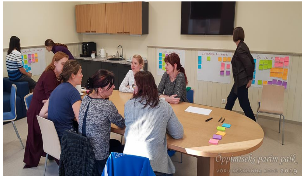
Lapsevanemad ja õpetajad ühisel tööhoos.