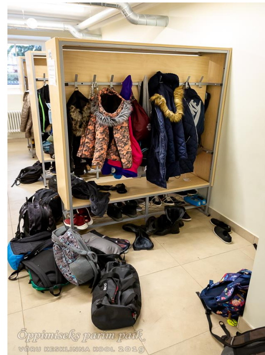
Mõnikord võib juhtuda ka nii...

Uue läbimõeldud ja struktureeritud korrapidamise süsteemi järgi on igal objektil kaks õpetajat, mis tagab selle, et alati on vähemalt üks õpetaja kohal. Korrapidamise eesmärgiks on tagada õpilaste turvalisus, ennetada kiusamisjuhtumeid ning suunata õpilasi pikal vahetunnil õue. Ühel päeval täidab korrapidaja ülesandeid 18 õpetajat. Igal õpetajal ja juhtkonna liikmel on kohustus korda pidada kahel päeval nädalas. Korda peetakse erinevates kohtades ning graafikud, mille koostab õppejuht, muutuvad trimestrite kaupa. Nii saab õpetaja parema ülevaate vahetunnis koolis toimuvast ning mõistab erinevate kohtade korrapidamise spetsiifikat ja olulisust. Õpetaja koolist puudumise korral ei ole muret, et see objekt jääks valveta. Kui õpetaja viibib koolitusel või muul põhjusel koolist eemal, on ta kolleegiga kokku leppinud korrapidamise vahetuse. Selline KOOSTÖÖ,