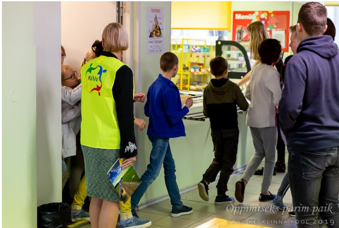
Söögivahetund kooli sööklas. Korrapidajaõpetaja reguleerib sööklasse sisenemist.