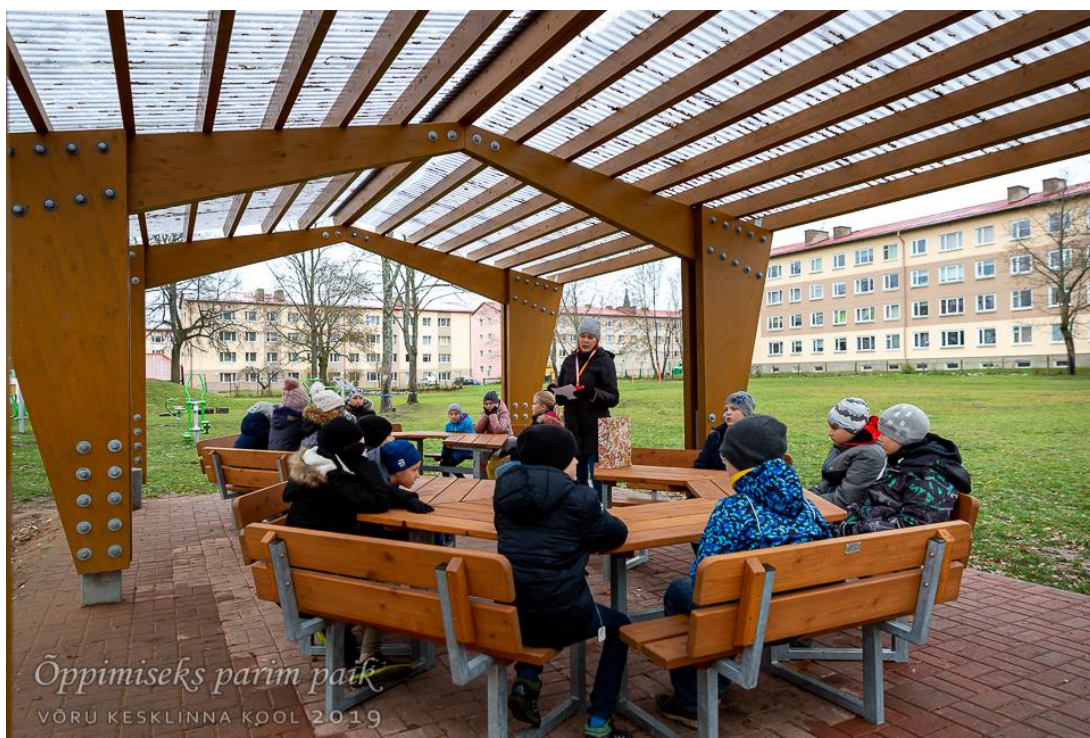
4.b klassi klassijuhatajatund kooli väliklassis.