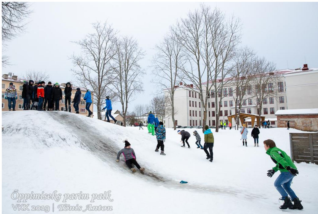
Liugu saab lasta oma „Munamäel“.