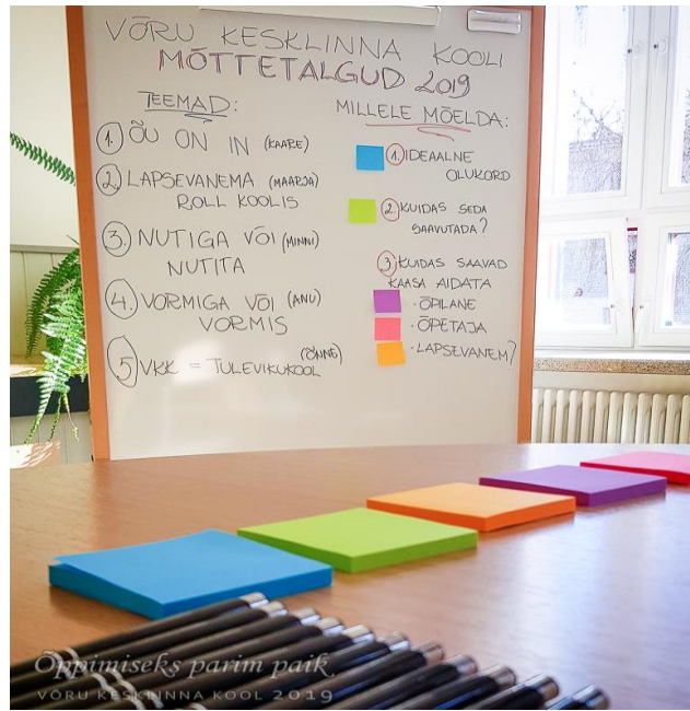
VKK mõttetalgud 2019.

Mõttetalgute tulemusena saime ülevaate, mida vanem koolilt ootab ning kuidas on valmis panustama. Mõningad ettepanekud leidsid koha uue õppeaasta tegevustes: nutiseadme keeld koolipäeva jooksul; õuealale kiigepargi rajamine; vanematepoolne abi kooli üritustel (lapsevanemad aitasid läbi viia kevadist laadapäeva ja esinesid kooli juubelikontserdil).