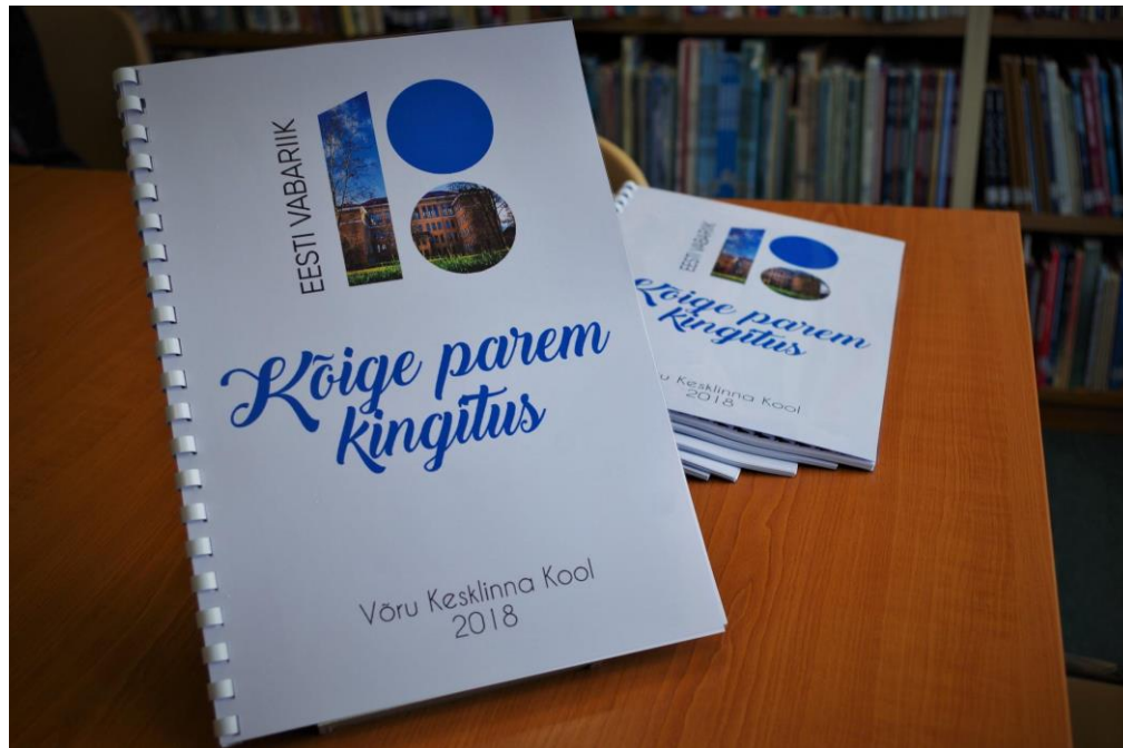
Almanahh “Kõige parem kingitus”

Tunnustati 22 õpilast pidulikul aktusel. Parimatest töödest andsime välja almanahhi „Kõige parem kingitus“. See üritus toetas isamaalisuse väärtustamist, mis pole küll otseselt meie kooli põhiväärtus. Õpilased said võimaluse tunda end riigi ja rahva osana ja läbi oma kirjatööde mõtiskleda oma isamaa üle.