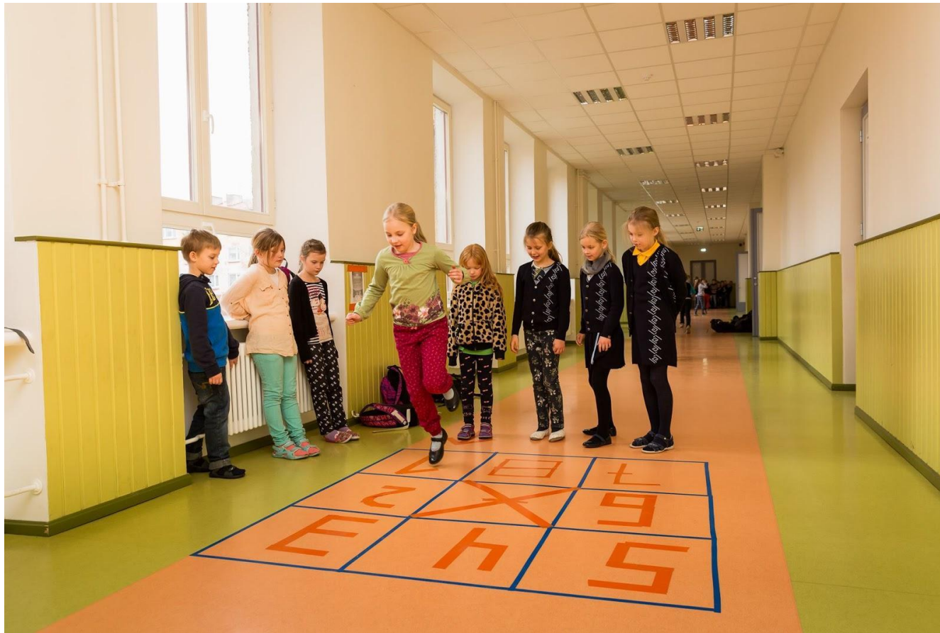
Reaalainete nädala raames kooli koridoridesse "joonistatud" keksukastid leidsid aktiivset kasutamist kõikides vahetundides.