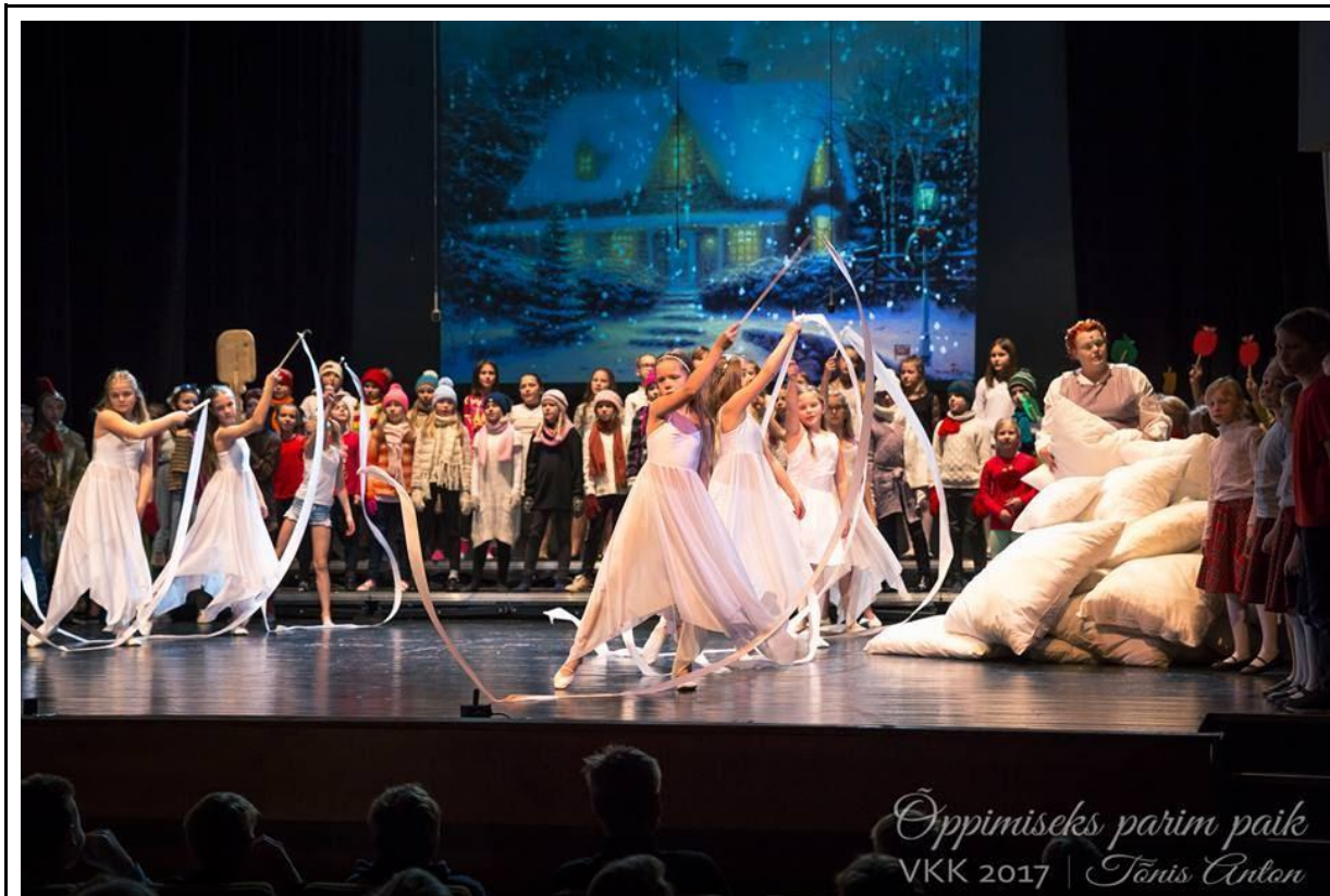
Muusikalis osalesid nii kooli koorid kui ka iluvõimlejad.