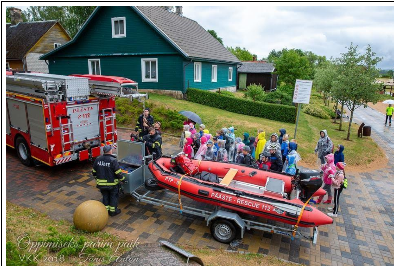
Päästeameti tehnikaga tutvumas.