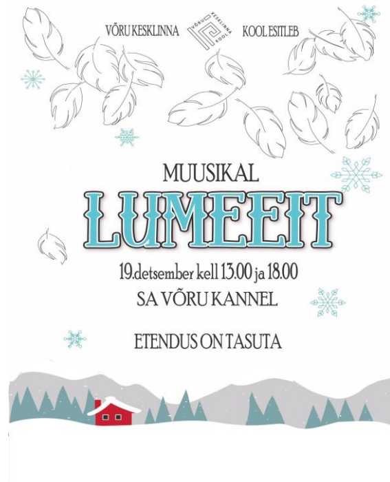
Muusikali “Lumeeit” plakat

Kuna meie koolis on 5 muusikasuunaga klassi, siis etendub igal jõulul traditsiooniline jõulumuusikal . 2017. a detsembris oli selleks “Lumeeit”. Muusikali valmimiseks tegid koostööd muusikaõpetajad, käsitöö ja tehnoloogiaõpetajad, kunstiõpetajad, klassiõpetajad, raamatukogu juhataja, liikumisõpetaja (lapsevanem), huvijuht, majandusjuhataja, direksioon. Ka muusikali temaatikat valides peame silmas oma kooli põhiväärtuseid. Muusikali “Lumeeit” sisu tõi vaatajate ja osalejateni, kui olulised väärtused on elus sallivus ja kohusetunne.