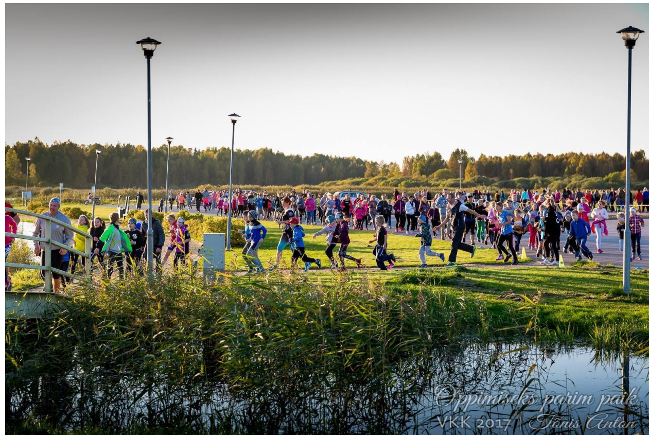
Jooksus osales mitusada kooli õpilast, töötajat, lapsevanemat ja vilistlast.