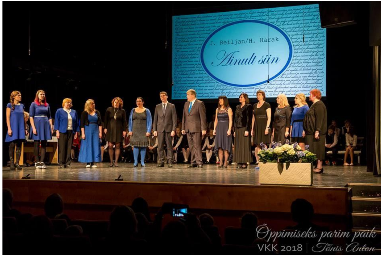
Õpetajate ansambel oma esimesel esinemisel.

Aktusel tunnustati kooli töötajaid silmapaistvate teenete eest ja õpilasi, kelle kirjatööd nägid trükivalgust almanahhis “Kõige parem kingitus.” Kõikide Võru Kesklinna Kooli aktuste korraldamisel lähtutakse lisaks kooli põhiväärtustele ka üldinimlikest väärtustest.