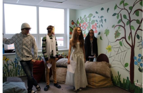
Pilt 24 Padjanurga valmimine