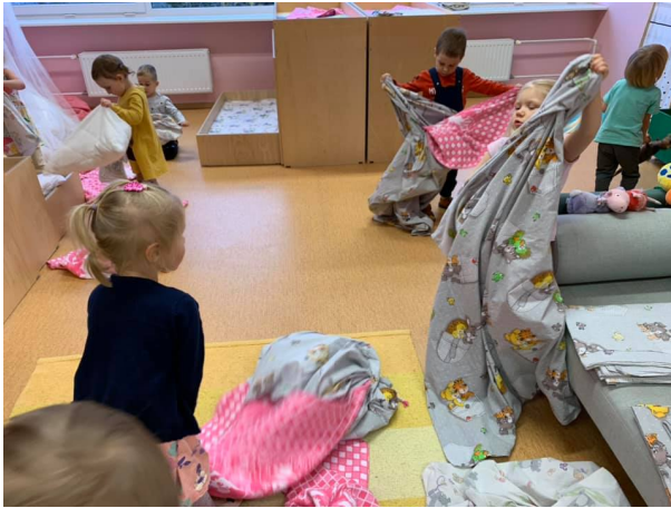
Rõõmutirtsud voodipesu vahetamas

kellel on suurem kohanemisvõime, on sellega kergem toime tulla, kuid järjepidevus ja laste kaasamise mõjust aru saamine on suureks abiks.