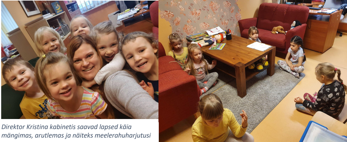
Direktor Kristina kabinetis saavad lapsed käia mängimas, arutlemas ja näiteks meelerahuarjutusi tegemas