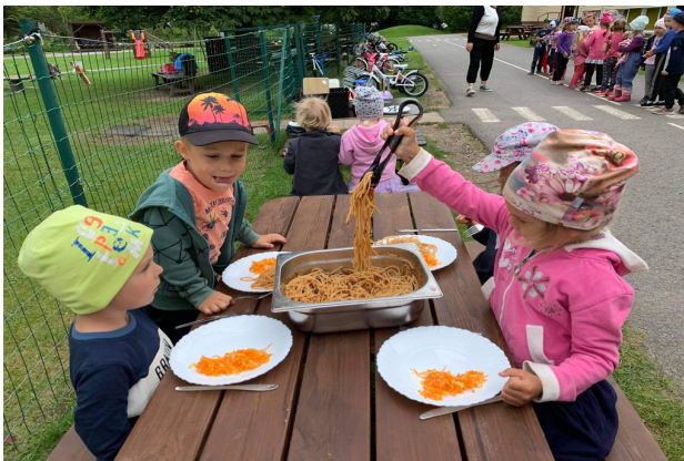
Lapsed ise lõunat serveerimas

Kõik lapsed ei pea kõike ühtemoodi ja samal ajal tegema. Hästi oluline on tajuda last ja mõista, mis just sellel hetkel last kõige paremini toetab ja siin ei saa olla universaalset lahendust, tuleb läheneda igale lapsele paindlikult ja individuaalselt. Näiteks ühes rühmas, kus lapsed alles alustasid lasteaiateed ja kõik lapsed ei olnud veel kohanenud, oli plaan minna väikesele matkale lasteaia ligidal olevasse parki. Ühele lapsele tekitas uude olukorda minek lisa stressi ja ta hakkas nutma ning polnud nõus matkale kaasa minema. Õpetaja lahendas olukorra nii, et jäi selle ühe lapsega lasteaeda ja see võimaldas tal pakkuda lapsele üks-ühele aega, mida see laps just sellel hetkel vajab. Kuna teisi lapsi ei olnud, siis oli õpetajal võimalus luua lapsega hea kontakt. Teised lapsed läksid õpetaja assistentide ja liikumisõpetajaga matkale. Peale seda olukorda, kus see laps sai õpetaja poolt pikemalt individuaalsemat