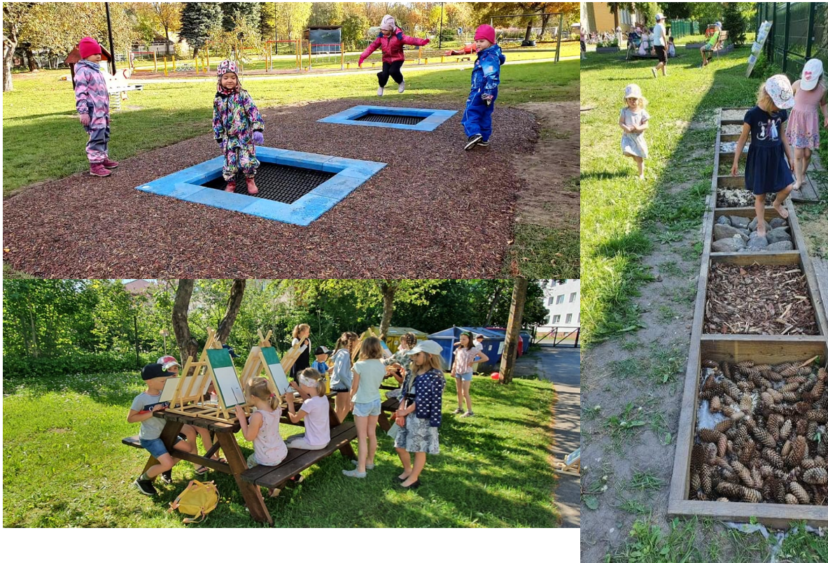
Koos lastega loodud tunnetusrada, kus saab paljajalu erinevaid looduslikke materjale tunnetada

Rühmameeskonnad on loonud lastele turvalise keskkonna, kus laps saab olla tema ise. Head suhted, hoolimine ja ühised head väärtused tagavad lastega ja nende vanematega head koostöosuhted. Iga pere on meile tähtis ja läheneme individuaalselt lahenduste leidmisele. Lasteaia une- või puhkeae g on koostöös lapsevanematega lahendatud selliselt, et lapsed kes ei vaja lõunaund, jäävad seni vaikselt tegevusi tegema. Lapsed, kelle vanemad on otsustanud, et nad peavad puhkama (kuid ei pea uinuma) on rahulikult voodis ja u kl 14 ajal tulevad nad vaikselt teisi segamata vooditest välja. Lapsed, kes uinuvad, nemad ärkavad kl 14:30 - 15:00 vahel, me teeme kardinaid pooleldi lahti, et lapsed saaksid omas tempos rahulikult ärkata. Nii oleme arvestanud kõigi laste vajadustega, väldime kiirustamist ja puhkeaja osa on laste jaoks sujuv ja rahulik. Lapsevanematega koostöö ja paindlikkus rühmapersonali poolt on siinkohal väga tähtis. Meil on tehtud eelnev küsitlus lastevanematele ning vastavalt sellele teame, kellele uni ja puhkamine on väga tähtis, kes võib lihtsalt natukene pikutada ja kes lastest üldse voodisse ei lähe. Küsitlusi teeme iga õppeaasta alguses, et teada saada, kuidas lapse olekut