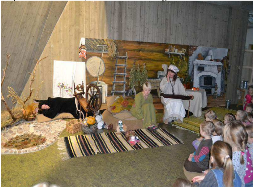
Eesti rahva jutuvestmispühal rehetares videvikutundi pidamas.