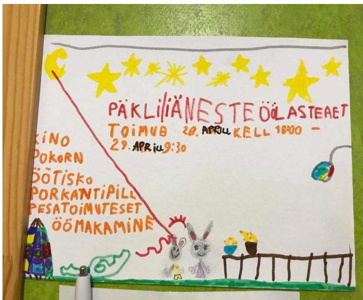
Laste poolt koostatud öölasteaia kuulutus

Koolieelikutel on võimalus kevadel, enne lasteaia lõpetamist, osaleda öölasteaia peol . See on laste seas kaua oodatud üritus, mille jaoks tehakse plaane juba nädalaid varem ning millest räägitakse ja muljetatakse veel nädalaid hiljem. Rühma õpetajad veedavad lastega koos öölasteaias ja korraldavad neile erinevaid tegevusi, nt disko, öökino, erinevad mängud. Kõige rohkem meeldib lastele, et magamineku ajal pole piiranguid, st et saab magama minna just siis kui süda lustib. Hommikul, ürituse lõppedes, väljastatakse lastele tunnistused kirjaga “oled läbinud õppused kodust eemal ööbimises ja oled valmis nüüdsest iseseisvalt elu alustama”.