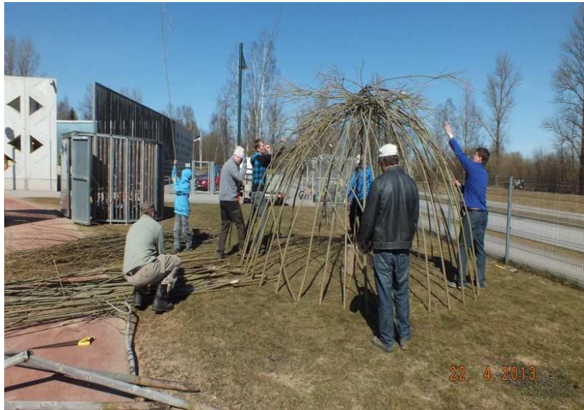
Koos isadega onni ehitamas.

Koostöös vanematega korraldame juba aastaid Mihkilaata , et koguda lisatulu lastele mänguasjade, pillide vm soetamiseks. Laste seas on see kaua oodatud üritus, mis loob võimalused ostlemiseks, müümiseks ning on toredaks ajaveetmise võimaluseks peredega ja sõpradega. Koostöös peredega kujundatakse müügiletid, küpsetatakse, meisterdatakse ja müüakse. Eelmisel õppeaastal leppisime kokku, et kogutud tulu kasutame heategevuseks , et suunata lapsi nägema, et paljudel lastel ei ole nii hästi läinud kui meil ja arendada lastes soovi märgata ning aidata meist halvemas olukorras olijaid. Tegutsesime kõik ühise eesmärgi nimel – nii lapsed, vanemad kui lasteaia personal. Mida laadal müüa? ja Kellele annetus teha, see arutati läbi lastega ja rühmade ümarlaudadel, mille tulemusel kujunes ühine otsus, et annetame tulu organisatsioonile Minu unistuste päev . Annetustest saadud tulu anti üle ühiselt ja pidulikult. Käesoleva aasta mihklilaada tulu kasutatakse enda hingele pai tegemiseks, st tehakse koos vanematega mingi tore ettevõtmine. Vahepeal tuleb ennast ka hellitada!