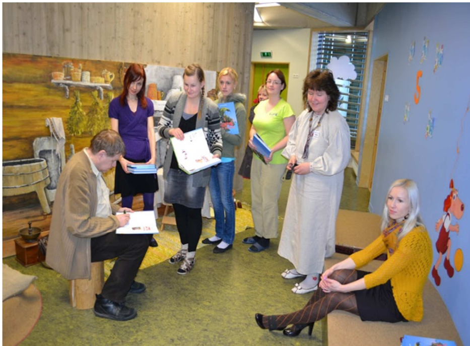
Külla tuli “Lotte isa” Andrus Kivirähk.

Igal õppeaastal valime ka ühe Eesti lastekirjaniku, kelle loomingut õppeaasta jooksul lastele tutvustame. Lapsed on saanud tuttavamaks näiteks Eno Raua, Ellen Niidu, Oskar Lutsu, Aino Perviku, Heiki Kripsi, Andrus Kivirähki ja teiste loominguga. Meil on olemas ka oma laenuraamatukogu- koostöös vanematega oleme paigaldanud lasteaia õuealale raamatukapi, kust saab raamatuid võtta ja kuhu vanemad saavad kodus loetud raamatud teistele lugemiseks tagasi tuua. Raamatukapist saavad lapsed raamatuid ka õuealal kasutada- kui soovid vaikset tegevust, siis on raamat parim kaaslane.