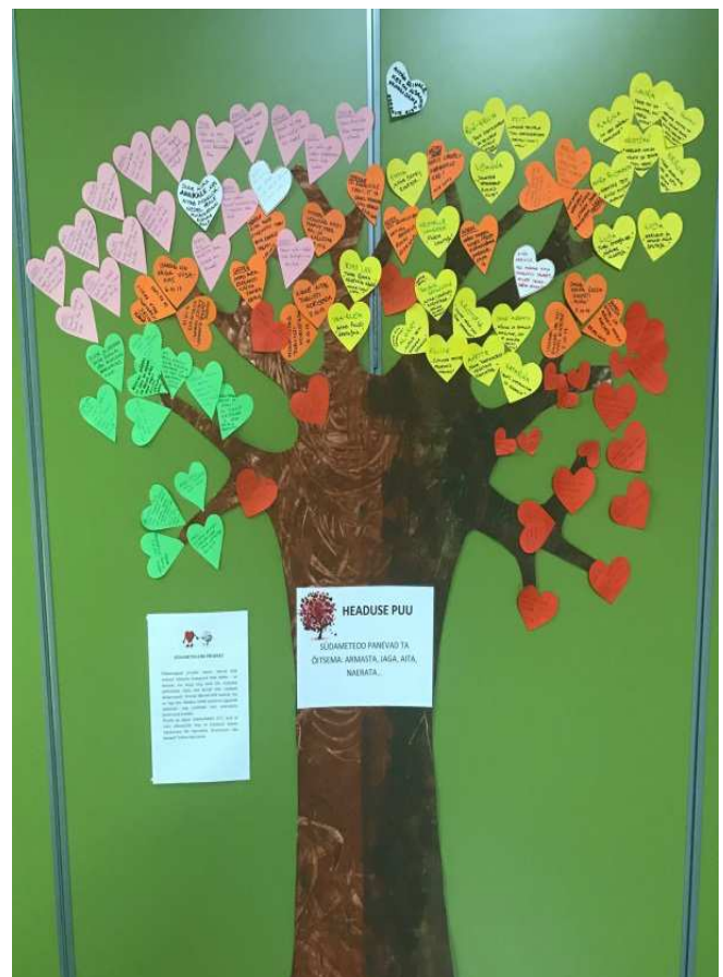
Headuse puu, millele kogunenud südametegude kirjeldused paneva ta õitsema.