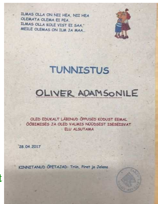
Tunnistus öölasteaia läbimise kohta