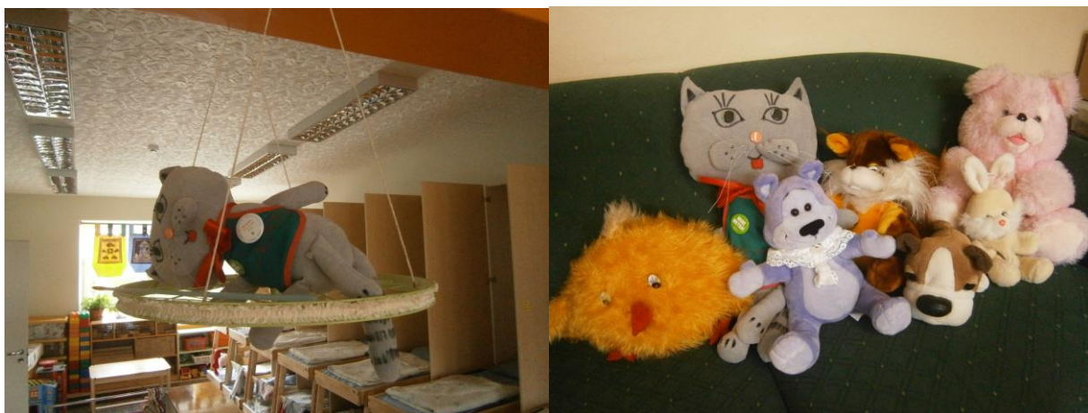
Kiti-Kätt lõunauinakul koos lastega