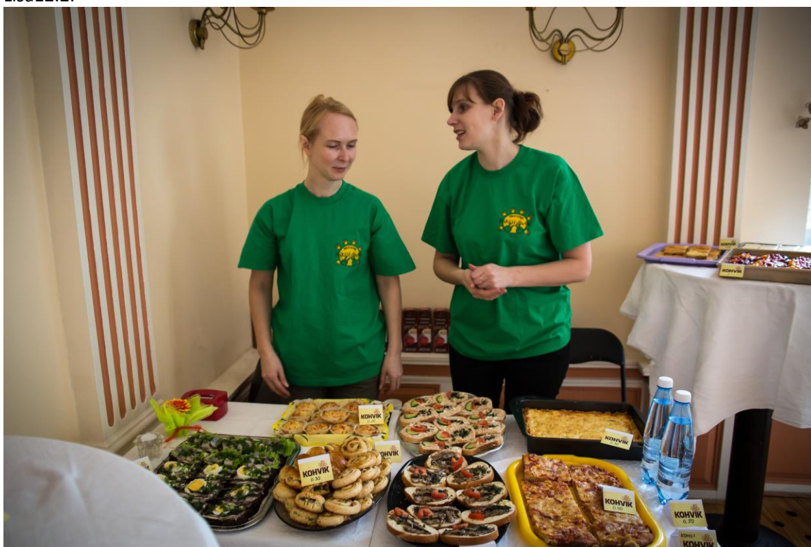
Päikesejätkud heategevusliku kohviku pidajad lasteaia logoga särkis.