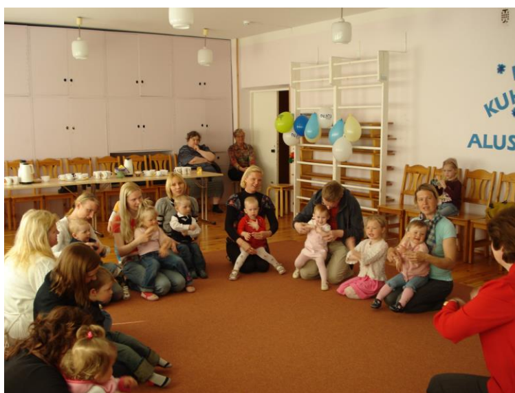
Tublitupsud lauluhoos, vahva meil on olla koos.