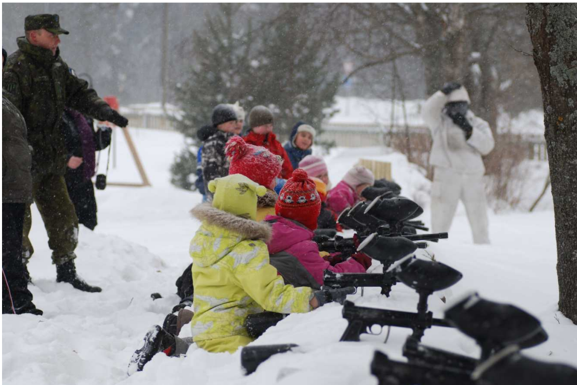
14. Kalevi pataljon õpetab püssi laskma (muidugi mängult)