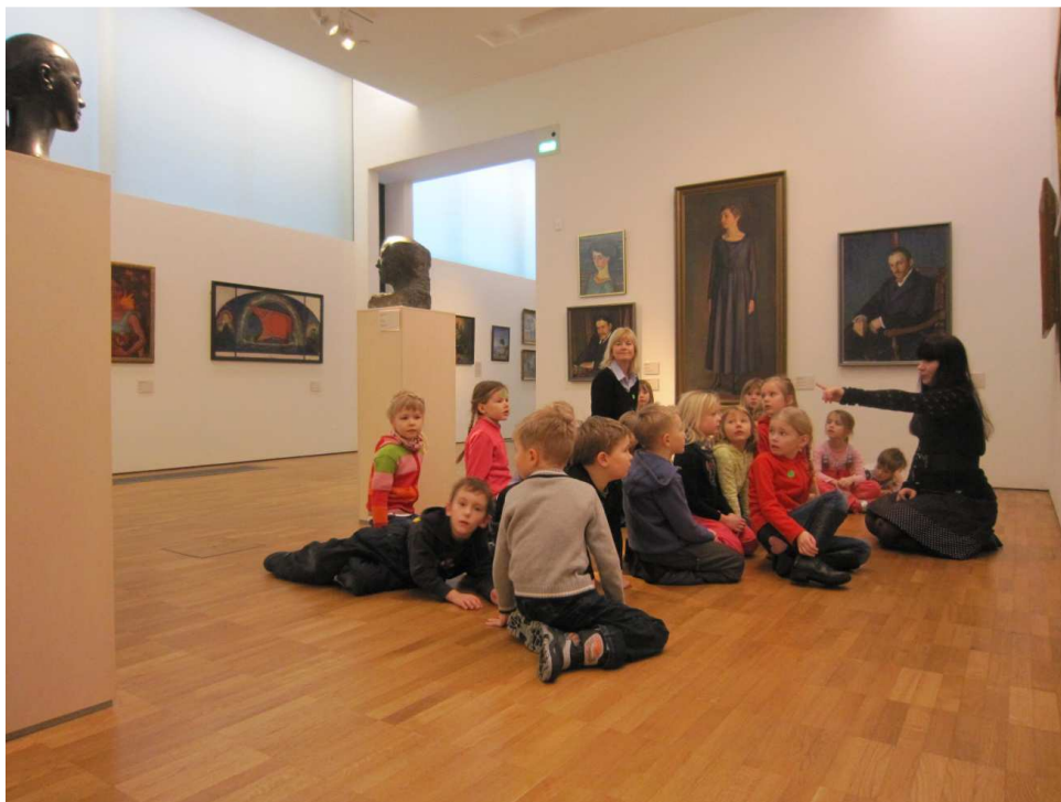
15. KUMU kunstisaalis toimub järjekordne õppesessioon