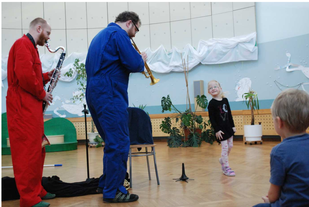
17. Taani bänd Klangbein pani lapsed oma „pilli järgi tantsima“