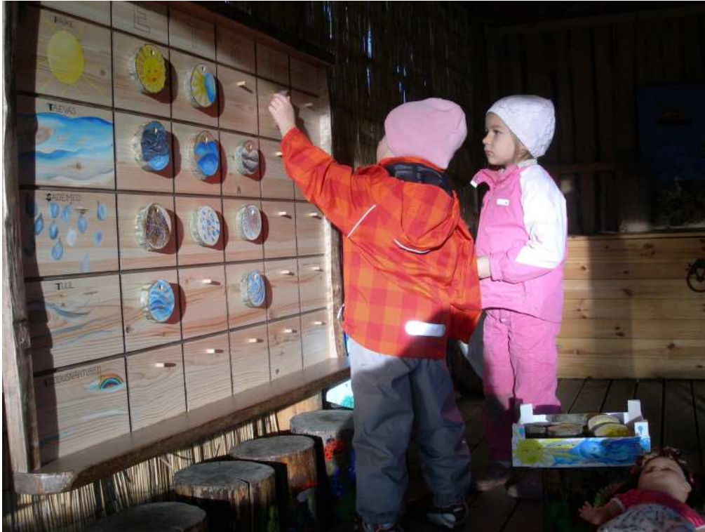
1. Loodusklassis asub „Ilmajaam“ ja ...