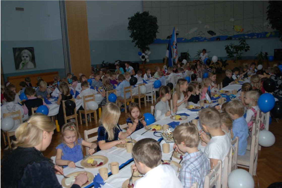
15. Vabariigi sünnipäeva puhul kaeti saali suur ühine pidusöögi laud