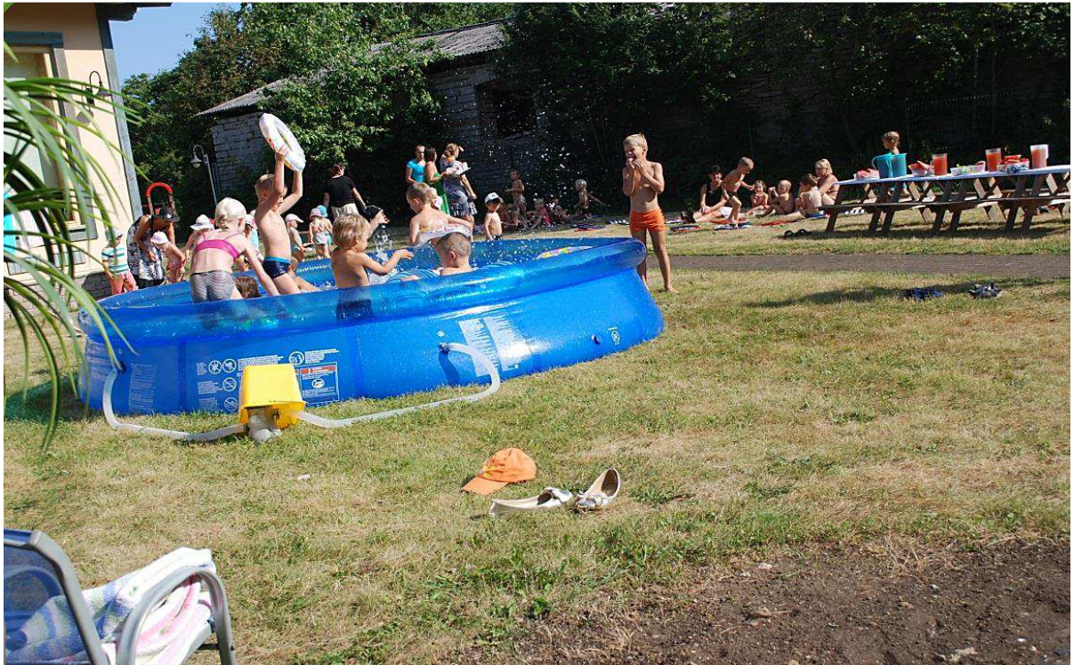
9. Basseini pidu oli 2014 aasta augustis pea iga päev