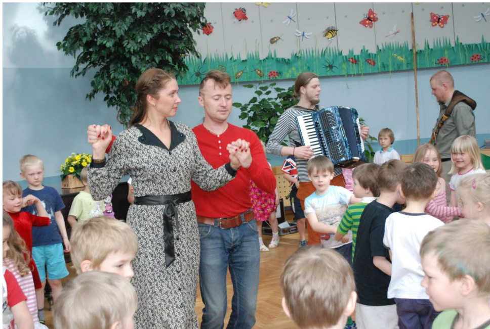
18. Kevadel toimus Svjata Vatra suur simman koos vanematega