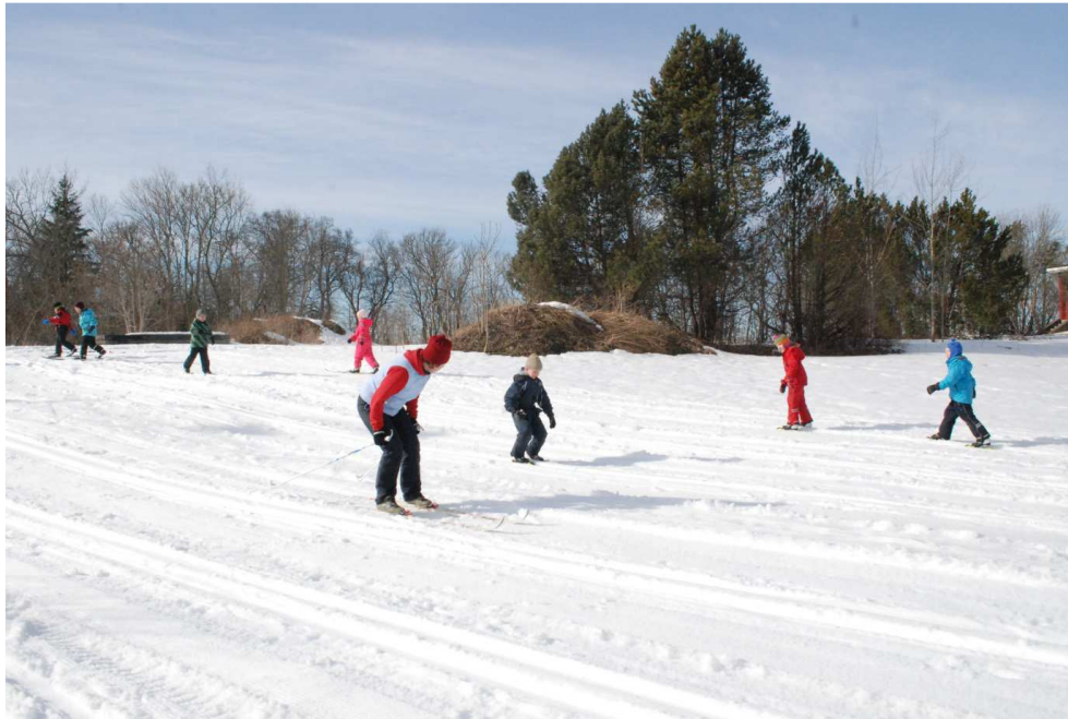
7. suusatreeneri juhendamisel õpivad lapsed mäest laskumist