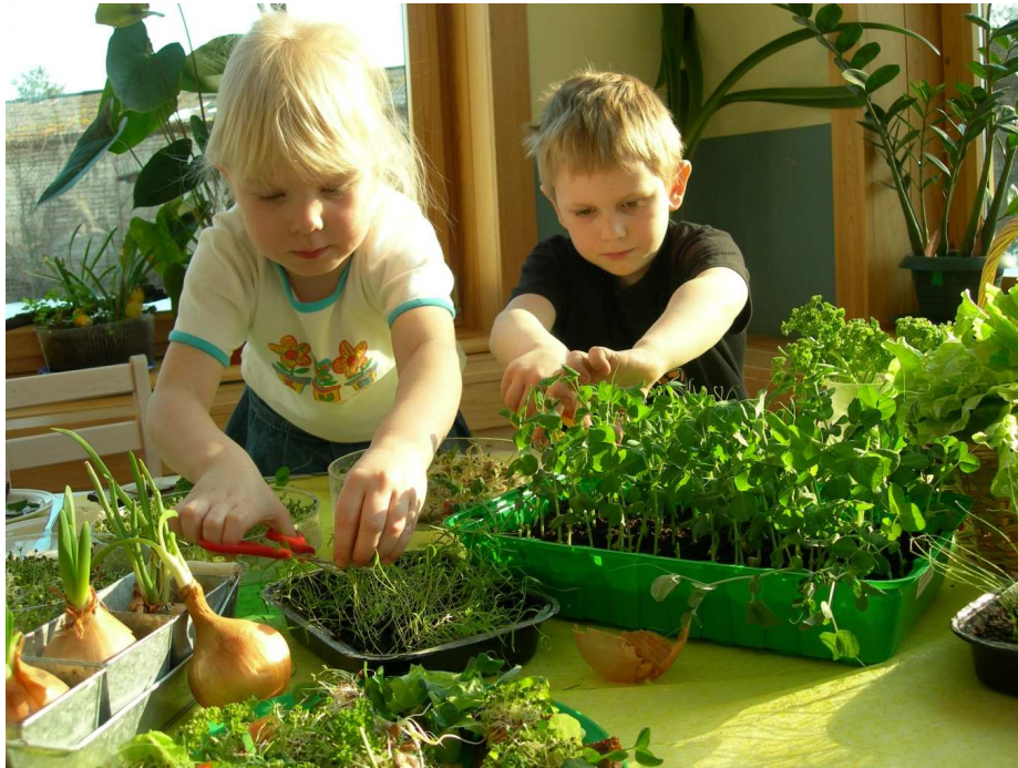
3. Kevadeti kasvatavad lapsed rühma aknalaudadel sibulaid, salateid, ajatavad võrseid