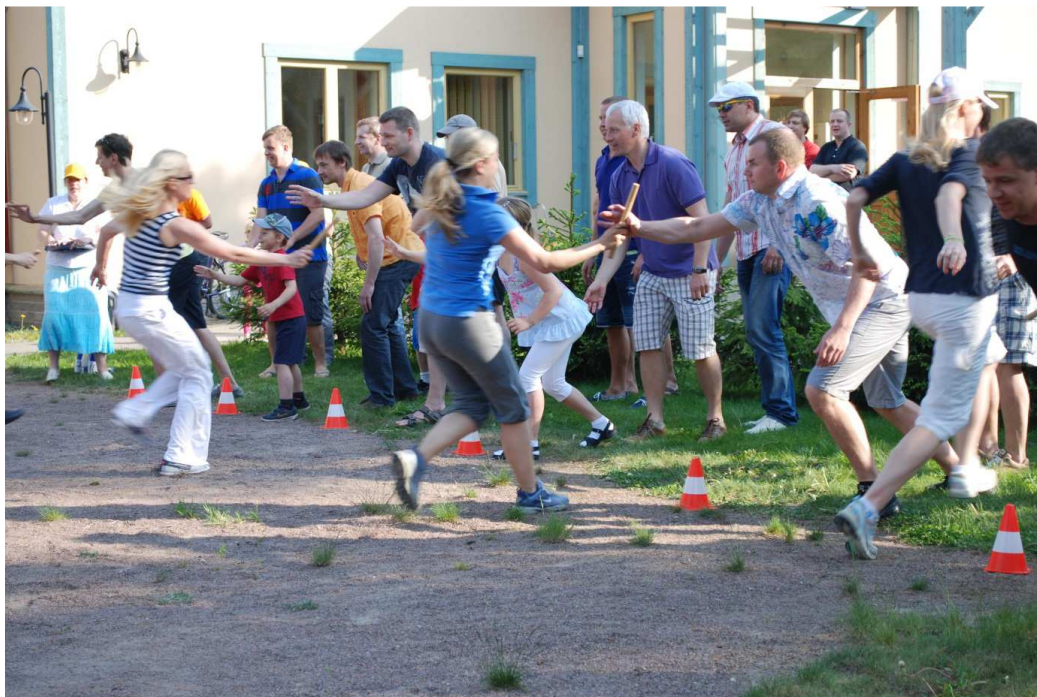
23. Igakevadise perespordipäeva oodatuid võistlus (nii lastel kui vanematel) on vanemate teatevõistlus