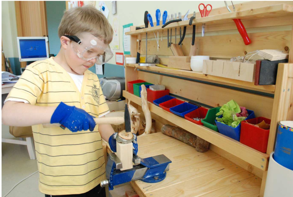
5. Puutöökeskus Murumunade rühmas on vaieldamatult kõigi Rannamõisa lasteaia poiste lemmikkoht