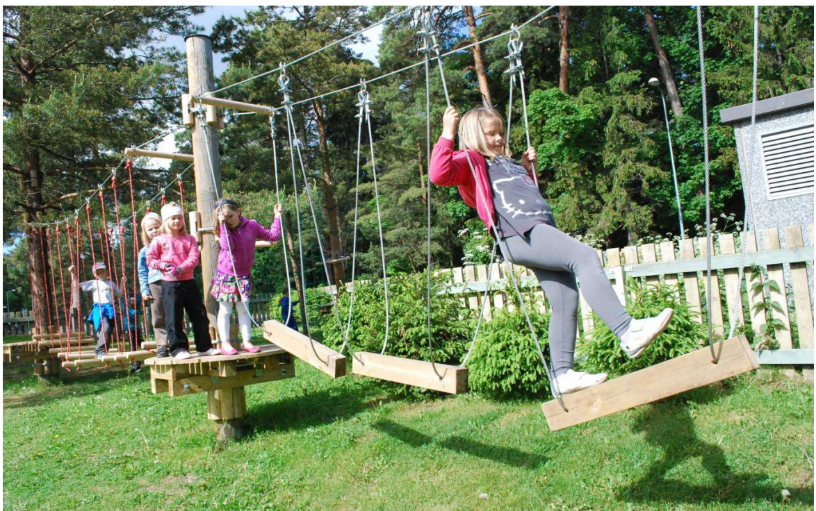
10. Seiklusrada lasteaia õuel on laste lemmik tegevuskoht