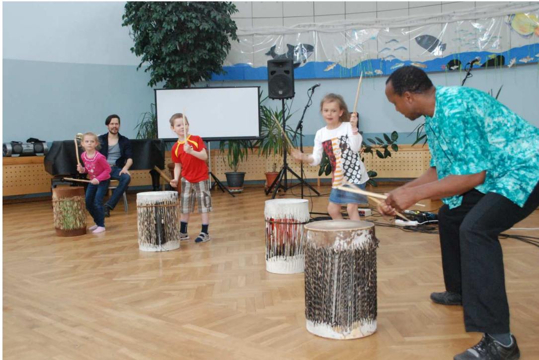
16. Pole-Pole kontsert kus lapsedki said olla muusikud