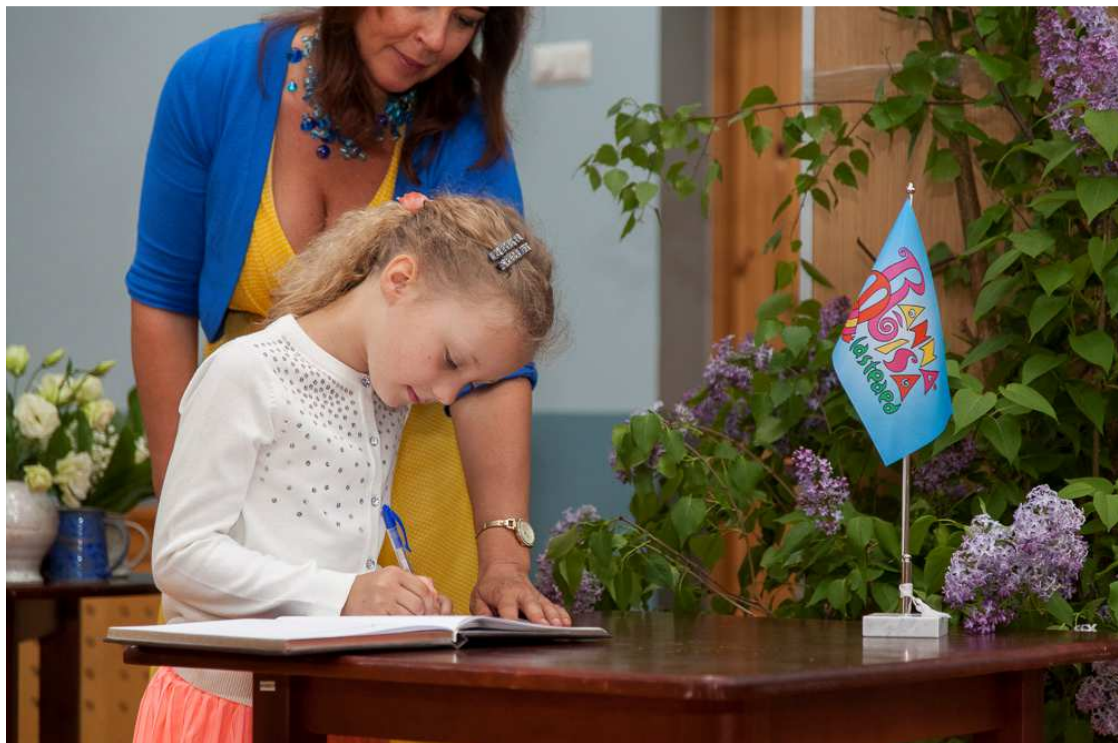
16. Lasteaia lõpuaktusel kirjutab laps oma elu esimese „allkirja“