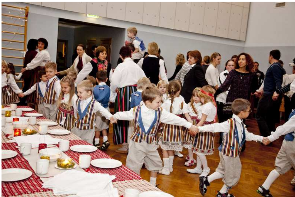
21. Rahvuslik jõulupidu koos peredega