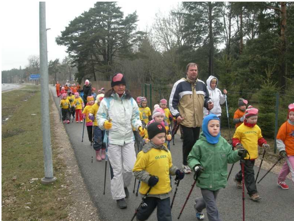
8. Kepikõnni matk aprillis, millega tähistasime rahvusvahelist südamenädalat