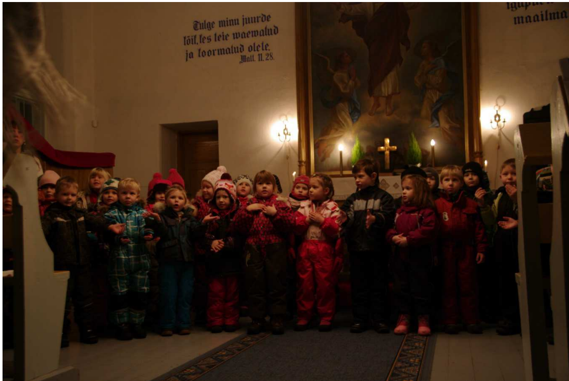
13. Jõulukontsert vanematele Rannamõisa kirikus