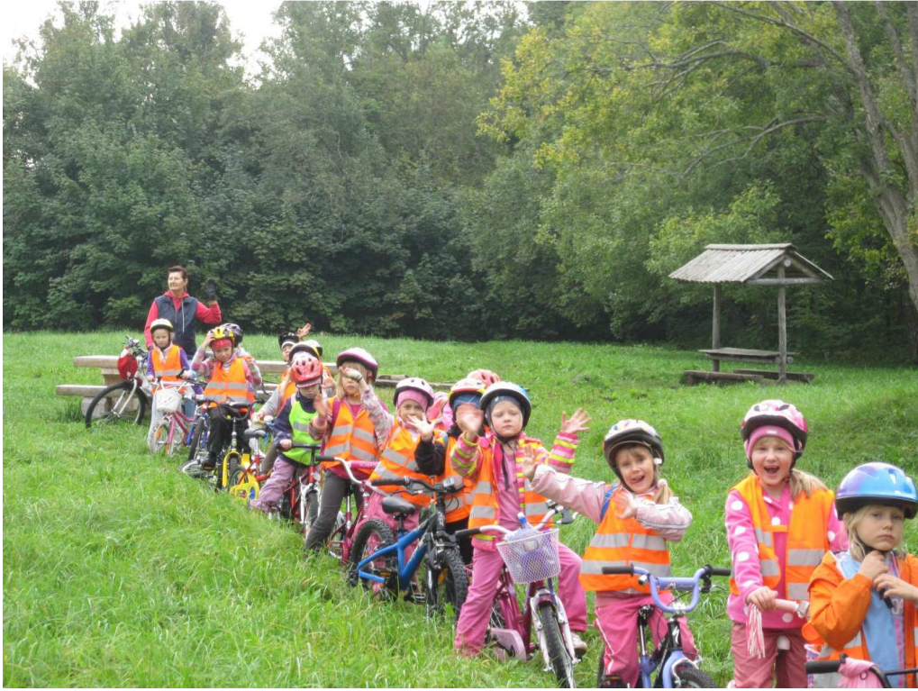
11. Rattamatk metsas