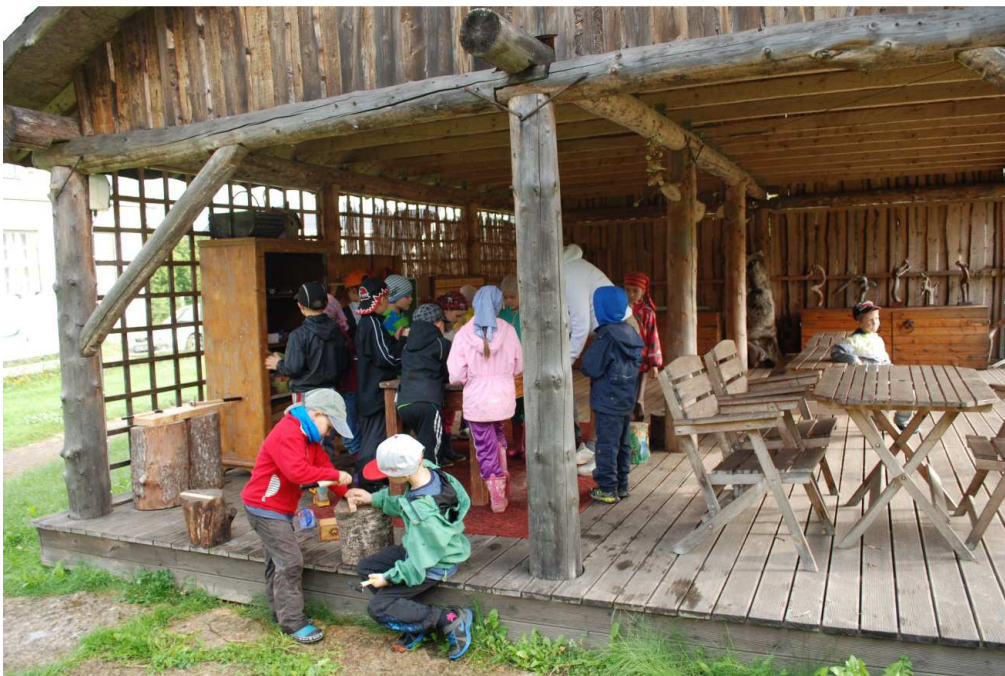
2. ... puutöö keskus