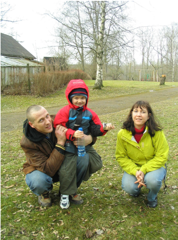
Perepilt Jan-Gareli Päeval

Puhja Lasteaia 17-aastane Lapse Päeva korraldamise kogemus on igati väärt, et seda veel laiemalt tutvustada. Alati kui meil külalised käivad, siis oleme lahkelt oma kogemusi jaganud ja innustanud ka kolleege, et see väärt tava jõuaks ka teistesse Eestimaa lasteaedadesse. See on hea võimalus kasutada ära tekkivat sünergiat lasteaia ja pere vahel, sest koos otsustades ja koos tegutsedes saame muuta lasteaiaelu mitmekülgsemaks ja lastele veelgi huvitavamaks. Lapse päeva korraldamine annab suurepärase võimaluse lastele rääkida kui oluline on iga pere väärtustamine, et kõik pered on võrdselt tähtsad ja olulised, hoolimata pere majanduslikust olukorrast, elukohast, pereliikmete arvust vms.