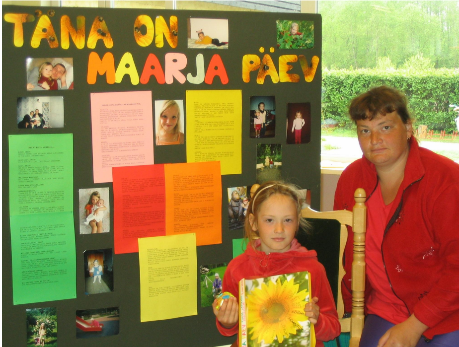
Täna on Maarja Päev

1994. aastal oli Puhja Lasteaial õnn esimeste seas liituda Eestimaa lasteaedadesse jõudnud programmiga Hea Algus, kus oli meie jaoks täiesti uudsel moel kirjeldatud ka koostööd lastevanematega. Rühmade vanematekogud on vaid üks näide uuenduslikust lähenemisest. 1995. aastal toimunud lastevanemate koolituselt tõid 3-4-aastaste rühma laste vanemad kaasa idee hakata korraldama Lapse Päevi. Ühisel arutelul rühmatöötajatega pandi paika selle päeva põhimõtted. Ja nii lihtsalt oligi sündinud tänaseni kestev ainulaadne traditsioon - Lapse Päev!