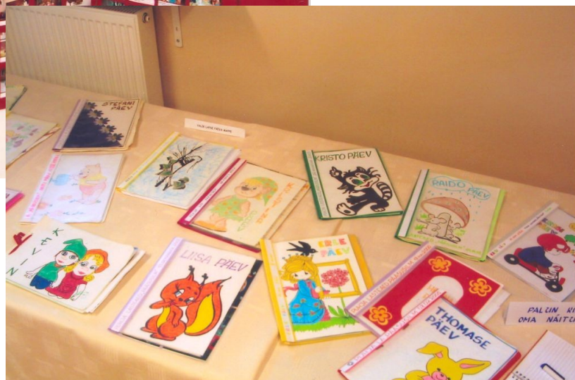
Näitus „10 aastat Lapse Päevi Puhja Lasteaias“