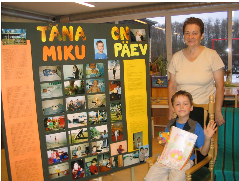
Täna on Miku Päev

Juba eelmisel päeval joonistavad lapse rühmakaaslased lapsest pildi /portree, lisatud kommentaarid kirjutab üles õpetaja. Kõik tööd köidetakse Lapse Päeva mappi, mille esikaant kaunistab õpetajate poolt käsitsi joonistatud tiitelleht ja kiri lapse nime ja kuupäevaga, mil Lapse Päev toimus.