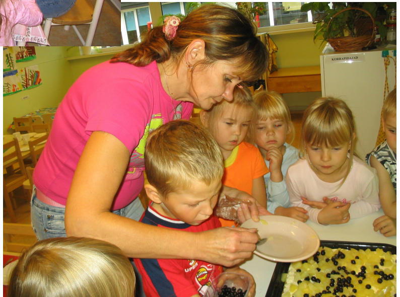
Kenari Päeval valmistati ühiselt küpsisetorti

Kogu selle aja on aktiivses tegevuses lapse pere, kes koos õpetajatega loob torelda meeleolu ja hea võimaluse olla sel päeval ainult ühel lapsel kõige tähtsam ja erilisem. Sel lapsel on eelis valida ühismänge ja olla mängu juht, olla lasterivis esimene, kui minnakse saali muusika –või liikumistegevusse, olla jalutuskäigul esimene paar koos parima sõbraga. Oluline on märkida, et teised lapsed aktsepteerivad niimoodi korraldatud päeva, sest nad kõik teavad (rühmas on sellest juba enne Lapse Päevade toimuma hakkamist räägitud), et ka nende tähtis päev juba toimus või on veel tulemas.