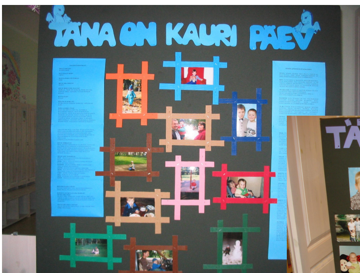
Kauri Päeva stend

kaasa, stendile toodud fotod lähevad samuti tagasi kodusesse fotoarhiivi.