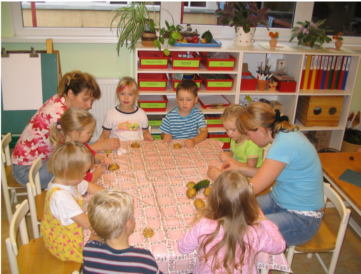
Marleeni Päeval meisterdasid lapsed looduslikust materjalist